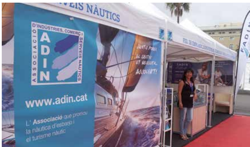
Saló Nàutic Barcelona 2013