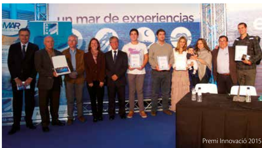
Premi Innovació 2015