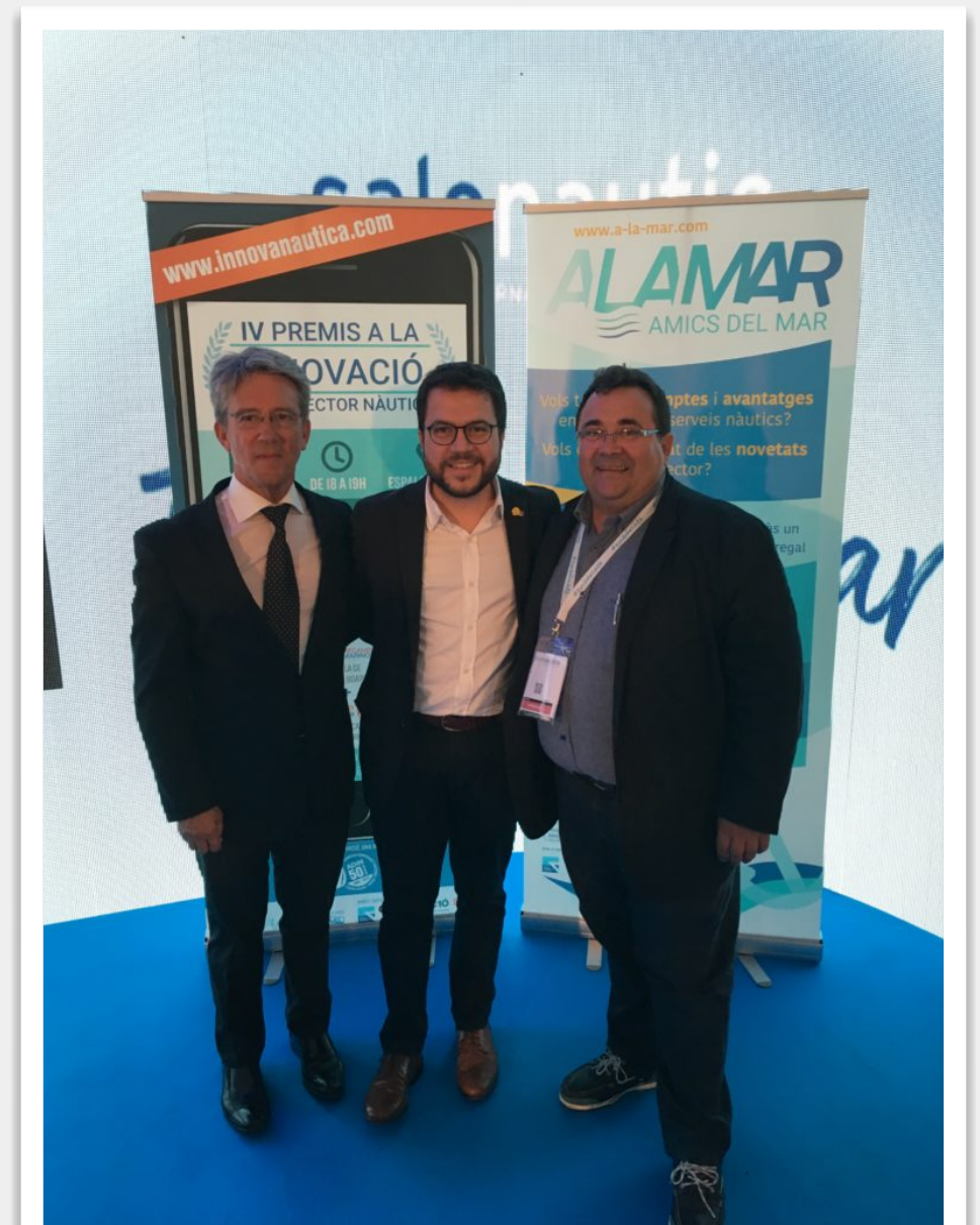
Senties i Guarner, amb l'Hble. Pere Aragonés, durant l'acte de presentació del 50 Aniversari de ADIN, al lliurament dels Premis a la Innovació en el sector.